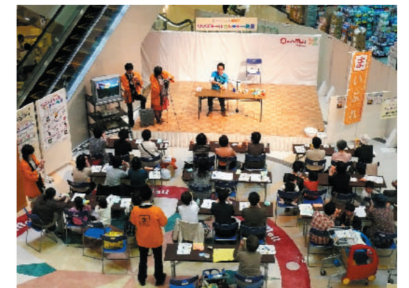
地域でのイベント風景

またこういった理念に共感し、全国にもフランチャイジーが広がりつつある。2009年2月時点で6社15地域にて展開中。フランチャイジーには自らのノウハウや反省点など（例えば、エリアを一気に広げすぎない等々）を伝え、マニュアルなどの支援体制を整備して、協力して事業を実施している。