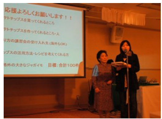
起業家を目指す人を支援する市民参加型応援イベントの様子

4. 事業の目標 育成する人材像：地域資源（農産物等）の生産、加工、販売（レストラン等）等のそれぞれの立場に必要な知識と経験を積みながら、お互いに連携して地域の活性化を図る、アグリビジネスを担う人材。 育成する人材数：3年で13人