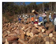
間伐作業 五右衛門風呂の薪に