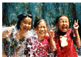
信州こども山賊キャンプ 川遊びの様子