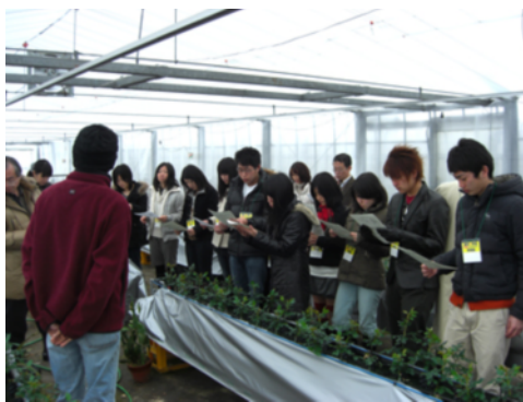
ハンズオン支援 農村学生交流ツアーの様子