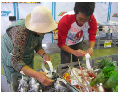
実践研修 直売所での研修の様子