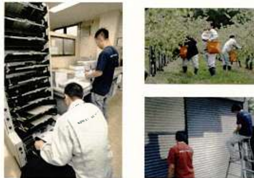
「ジョブトレ」の活動風景