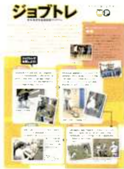
若年者就労基礎訓練プログラム 「ジョブトレ」

③特定非営利活動法人ライフワークサポート21（静岡県沼津市）：企業とのつながりが強く、集客と支援ノウハウを得れば自立できるため。