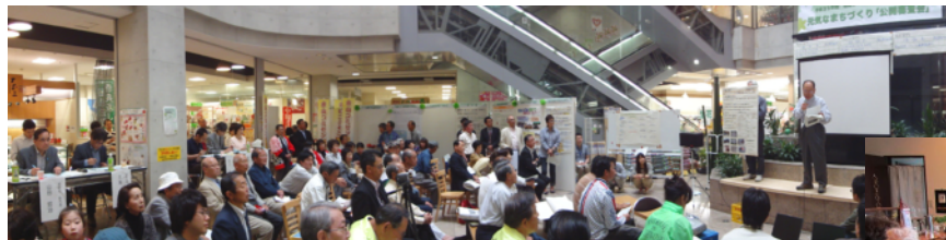
公開コンペ形式のCB支援事業（柏崎市／H23.5.21開催）

4. 移転先 NPO法人 風・波デザイン（岩手県紫波町）NPO法人アットマークリアスNPOサポートセンター（岩手県釜石市） NPO法人 杜の伝言板ゆるる（宮城県仙台市）NPO法人 NPOさんじょう（新潟県三条市） 中越沖復興支援ネットワーク（新潟県柏崎市）