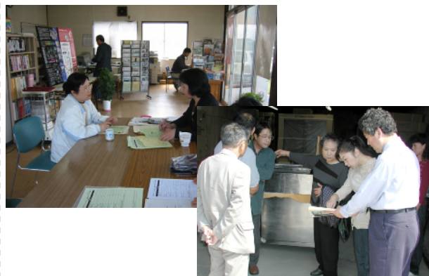
中間支援組織によるコーディネート