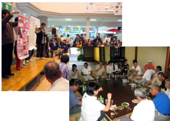
「起業家予備軍の育成」と「予備軍の成長を促す仕組み」

C B育成ノウハウの移転を希望する行政機関・中間支援組織を公募し、ヒアリング等を通じて移転先の実態を十分に把握した上で、5事業者を選定し、ノウハウを移転する。