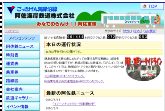
企業に納品したウェブサイト

4事業所とも、高い意識と情熱を持って障害者の社会参加と経済的自立を目指す団体であり、本会は、数年来、情報提供、技術支援ほかを行っている。