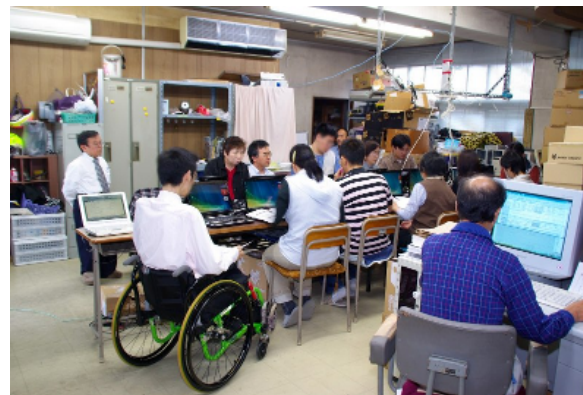
活動拠点での作業風景