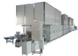
連続式大型海苔火入乾燥装置