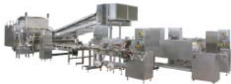
カニカマ製造装置

当社の主力製品は蒲鉾、豆腐、海苔などの食品加工機械です。特にカニ風味蒲鉾の製造装置では海外を含み、約7割のシェアを持っています。また、豆腐や海苔のように製法にも伝統のある食品分野においても、当社の最新技術が数多く採用されています。