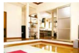
リフォーム施工写真