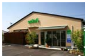
リファインしゅうなん（外観）