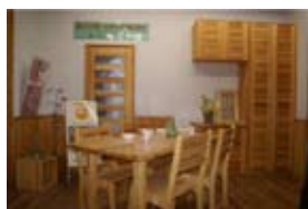
内装材（レッドパイン）