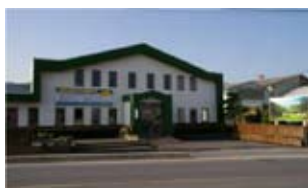
梱みうら本社（外観）

現在、山口県内を中心とした企業向け梱包資材事業（パレット・梱包材・強化ダンボール等）、大手ハウスメーカー向け木材加工事業、建具・造作材・オーダー家具等の内装材事業、一般ビルダー向け住宅用構造躯体事業（プレカット・パネル）、住宅事業（リフォーム・新築）の5つの事業展開を、社員数170名にて運営しています。