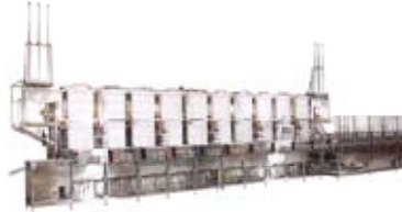
ジュール加熱式絹豆腐製造装置