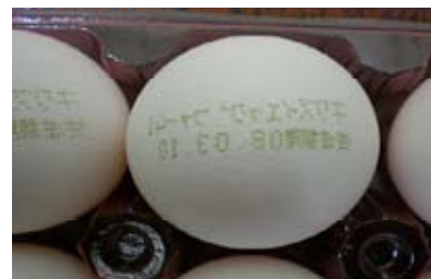
卵1個に賞味期限・生産地を記載（インクは緑茶成分）