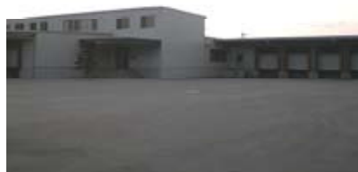
卵を処理するGP工場

平成3年に会社を立ち上げ、安心（安定供給）・安全（清潔）・新鮮（鮮度）を追及、得意先のニーズに合った商品を供給、今では熊本県シェアトップまで成長。他に飼料の販売、鶏卵の生産（100%出資会社 株式会社菊水エッグファーム）を手掛けており、平成19年12月に運送業の認可も得たことにより幅広い展開をしている。