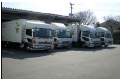
卵を配送する車両(全車緑ナンバー)