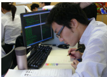
東戸塚での研修風景

設立時5名からスタートした会社が4年間で社員数220人、資本金1億3千万、売上8億3千万という業界No.1成長企業です。独自の教育システムは質の向上にこだわることによって多くの大手企業からオファーがあり、コアパートナーに選出される等、社外で高い評価を得られています。当然、全員正社員。「終身雇用」が合言葉です。