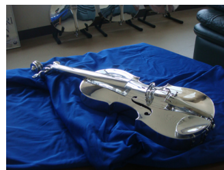
マグネシウム合金製バイオリン