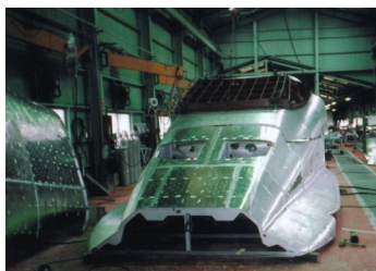
台湾新幹線先頭構体

東海道新幹線開業の前年、新幹線の顔を作る会社として創業。現在では、鉄道車両部品に加え、半導体製造装置向精密板金品等も製造。宇宙航空開発研究機構の次世代超音速機開発用の試作品治具など保有技術を応用した新分野の製品もおつくりしています。