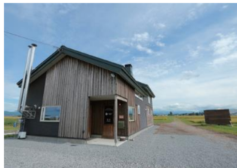
農村部にオープンしたカフェ