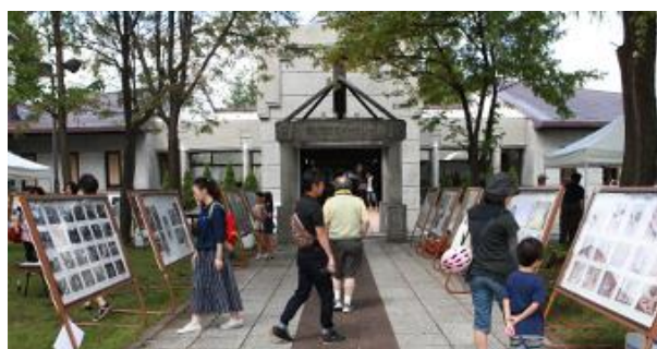
国際写真フェスティバル

これらの観光資源を活かして、観光入込客数の増加を加速させ、地域経済に波及効果が高い観光に関する事業を推進する。