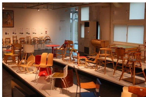
デザイン家具コレクション