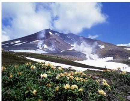
初夏の大雪山旭岳

これら、良質で多様な観光資源のほか、特に本町の強みとして、留学生の中長期滞在があげられる。旭川福祉専門学校が日本語学科を開設しているほか、平成27年には東川町が国内初となる公立日本語学校を開設しており、年間500人以上もの外国人が中長期滞在している。留学生は比較的裕福な者が多く、日本文化の理解や、滞在期間中の旅行等への消費には積極的な傾向にあり、旅行者等による短期滞在ニーズだけでなく、中長期滞在者による潜在的ニーズが地域内において常時循環しているなど、他地域にはない新たなビジネスチャンスが存在している。また、外国人留学生向けの日本文化紹介プログラムなど外国人の受入ノウハウや人的資源が蓄積されている。