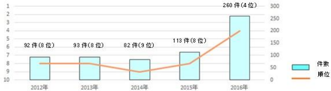
資料：神戸市における国際会議開催件数の推移