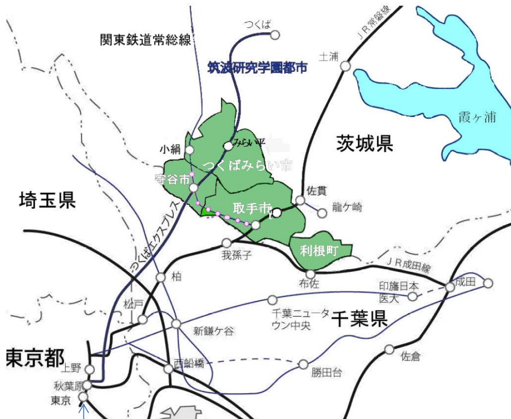
平成 26 年度東京駅乗り入れ