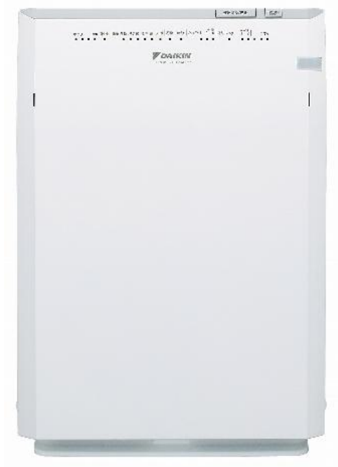
空気清浄機 ( 管理番号 : A200900489 )