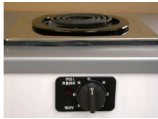
一口こんろ (前面操作) ※写真は富士工業製

身体や物が接触し、意図せずスイッチが「入」となる可能性がある構造であったために、電気こんろの上や周囲に可燃物が置かれていて、火災事故に至る危険性があります。