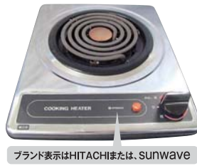
ブランド表示はHITACHIまたは、Sunwave