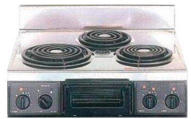
複数口こんろ (前面操作のみ)