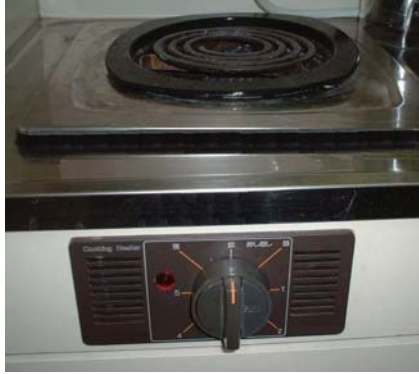
電気こんろ外観例

身体や物が接触し、意図せずスイッチが「入」となる可能性がある構造であったために、電気こんろの上や周囲に可燃物が置かれていて、火災事故に至る危険性があります。