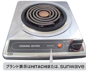
一口こんろ (上面操作)