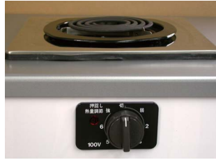
一口こんろ (前面操作) ※写真は富士工業製

身体や物が接触し、意図せずスイッチが「入」となる可能性がある構造であったために、電気こんろの上や周囲に可燃物が置かれていて、火災事故に至る危険性があります。