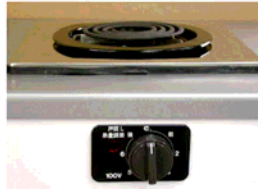
一口こまろ (前面操作) ※写真は富士工業製

身体や物が接触し、意図せずスイッチが「入」となる可能性がある構造であったために、電気こまろの上や周囲に可燃物が置かれていて、火災事故に至る危険性があります。