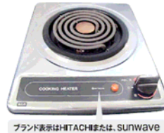
一口こまろ (上面操作) ブランド表示はHITACHIまたは、SUNWAVE