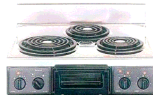
複数口こまろ (前面操作のみ)