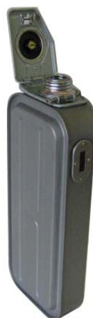
(当該製品の給油タンク)