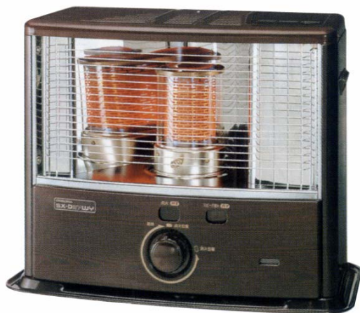
(写真はS X-D 2 7 W Y A)