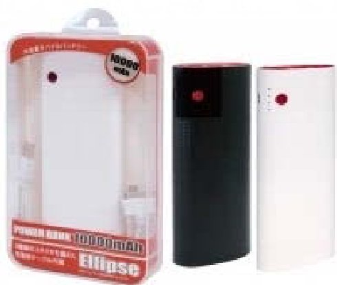
パワーバンク エリプス 10000mAh (HRN-265)