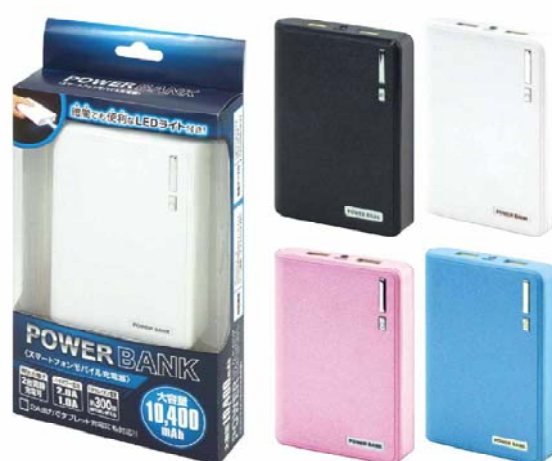
パワーバンク 10400mAh (HAC1182)