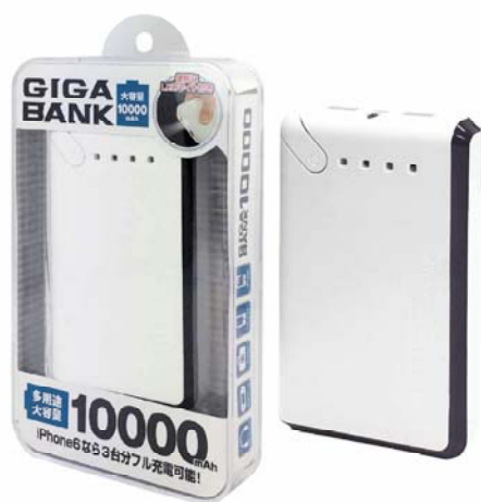
ギガバンク 10000mAh (HAC1078)