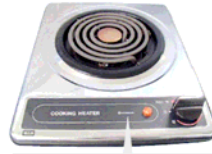
一口こんろ(上面操作) ブランド表示はHITACHIまたは、SUNWAVE