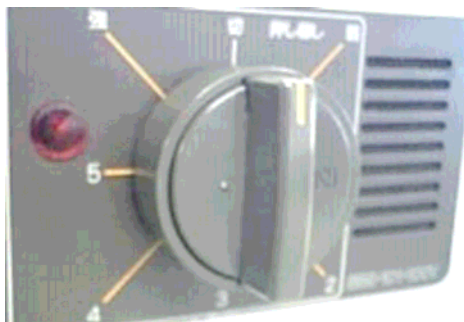
改修前：カバー無し