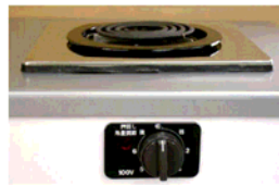
一口こんろ(前面操作) ※写真は富士工業製

身体や物が接触し、意図せずスイッチが「入」となる可能性がある構造であったために、電気こんろの上や周囲に可燃物が置かれていて、火災事故に至る危険性があります。