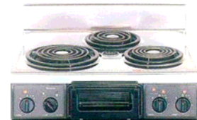
複数口こんろ(前面操作のみ)