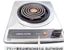
ブランド表示はHITACHIまたは、SUNWAVE 一口こんろ(上面操作)