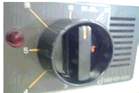
改修後：カバー付き