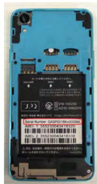
(スマートフォン本体内部)