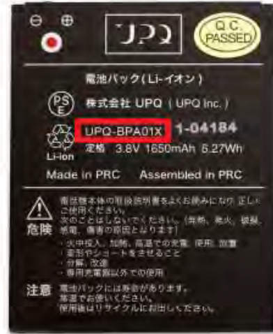
未対策品のバッテリーパック 対策済品のバッテリーパック