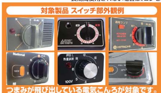
対象製品 スイッチ部外観例