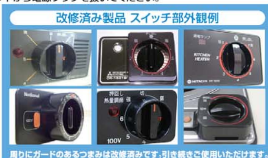
改修済み製品 スイッチ部外観例