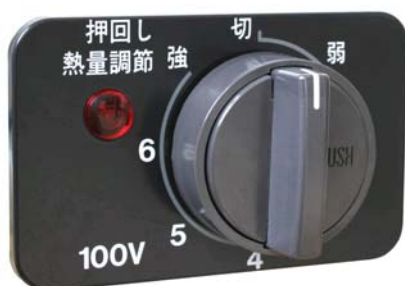
改修前：カバー無し