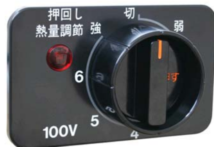
改修後：カバー付き