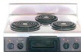
複数口こまろ(前面操作のみ)