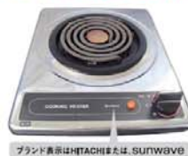
ブランド表示はHITACHIまたは、SUNWAVE 一口こまろ(上面操作)