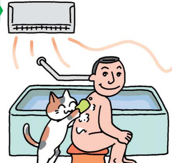
浴室用電気乾燥機