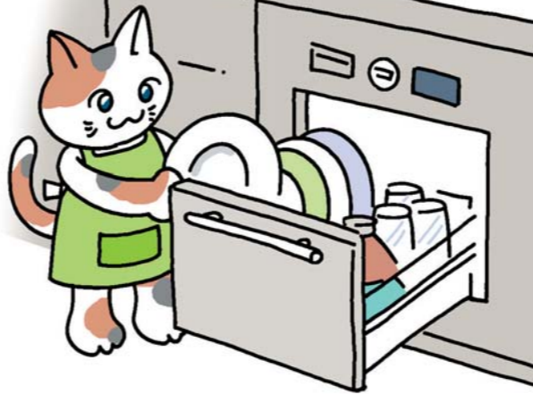
ビルトイン式電気食器洗機