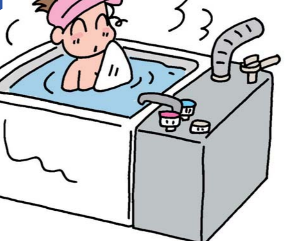
屋内式ガスふろがま (都市ガス用/プロパンガス用)