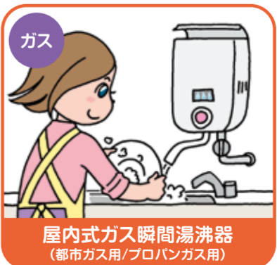
屋内式ガス瞬間湯沸器 (都市ガス用/プロパンガス用)