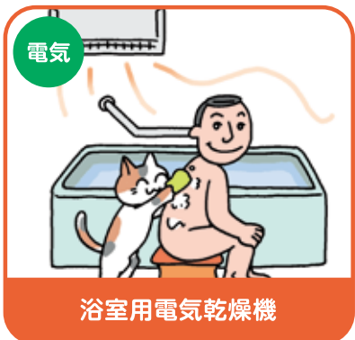
浴室用電気乾燥機