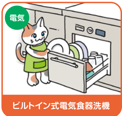
ビルトイン式電気食器洗機