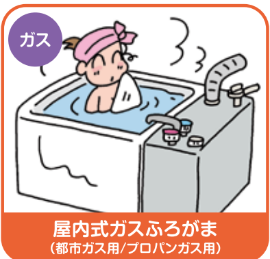
屋内式ガスふろがま (都市ガス用/プロパンガス用)

平成21年4月1日より前に製造・輸入された該当製品についても、製造時期を確認し、メーカーの点検を受けましょう。