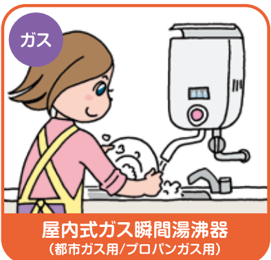
屋内式ガス瞬間湯沸器 (都市ガス用/プロパンガス用)