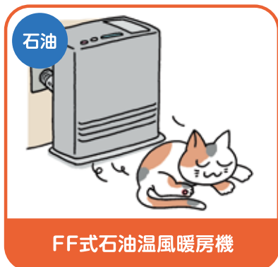
FF式石油温風暖房機