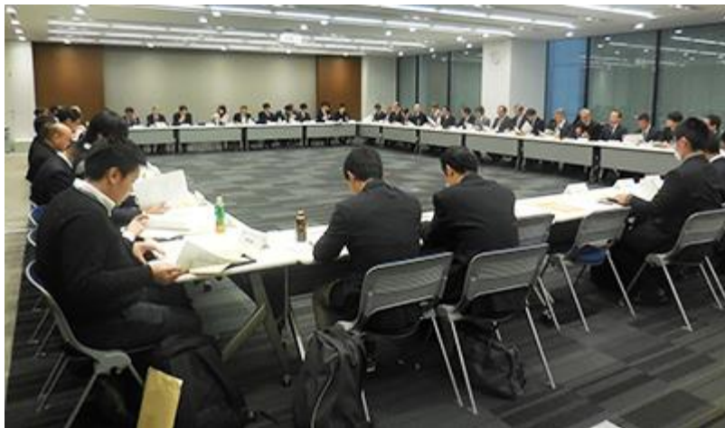
2017年度 製品安全コミュニティ 東京会場