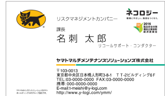
名刺 (ヤマトマルチメンテナンスソリューションズ)