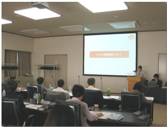
二次審査(プレゼンテーション審査)の様子