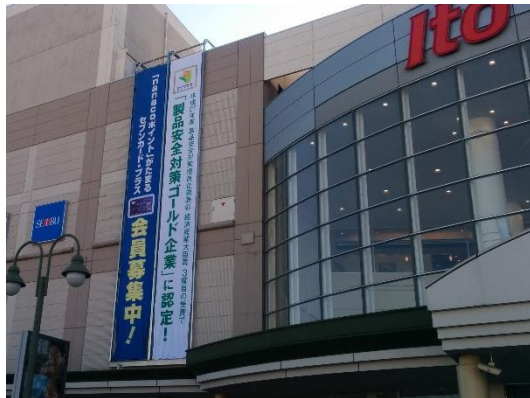
懸垂幕での紹介 (イトーヨーカ堂)

経済産業省主催の第10回製品安全対策優良企業表彰「経済産業大臣賞」を受賞しました