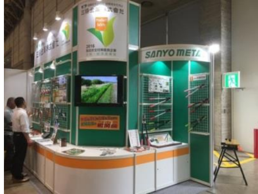
商談会ブースでの紹介 (三陽金属)