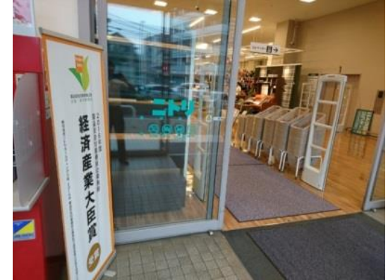
店頭でのポスター掲示 (ニトリ)