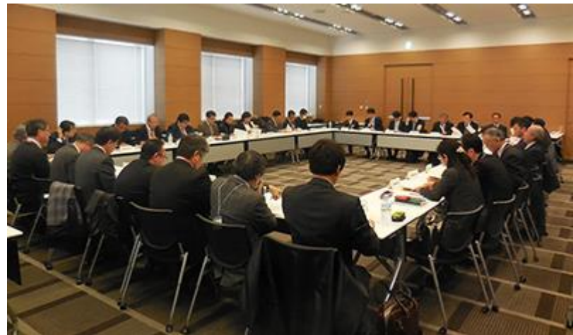
2017年度 製品安全コミュニティ 大阪会場