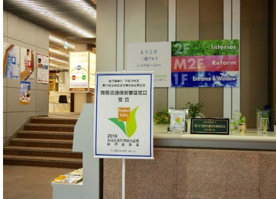
ショールーム受付に掲示 (三協アルミ)