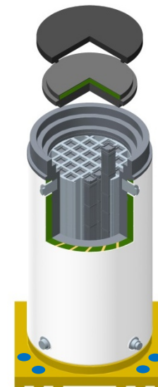
図2 乾式キャスクの構造