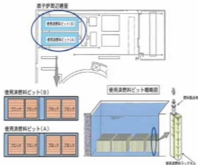
リラッキング関連施設概略図