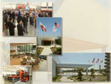
(イメージ) 昨年度のシリコンバレーミッションの様子