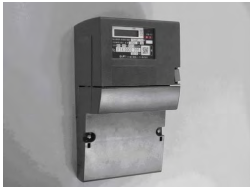
(左図) スマートメータ外観 (右図) SMA対応機器認証登録証