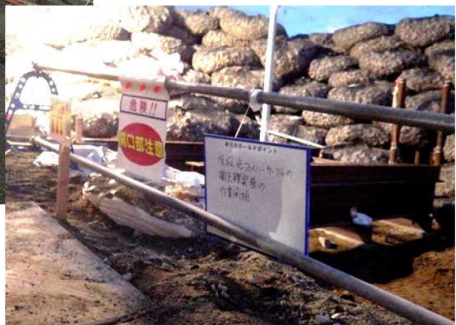
現地KYボードの掲示状況