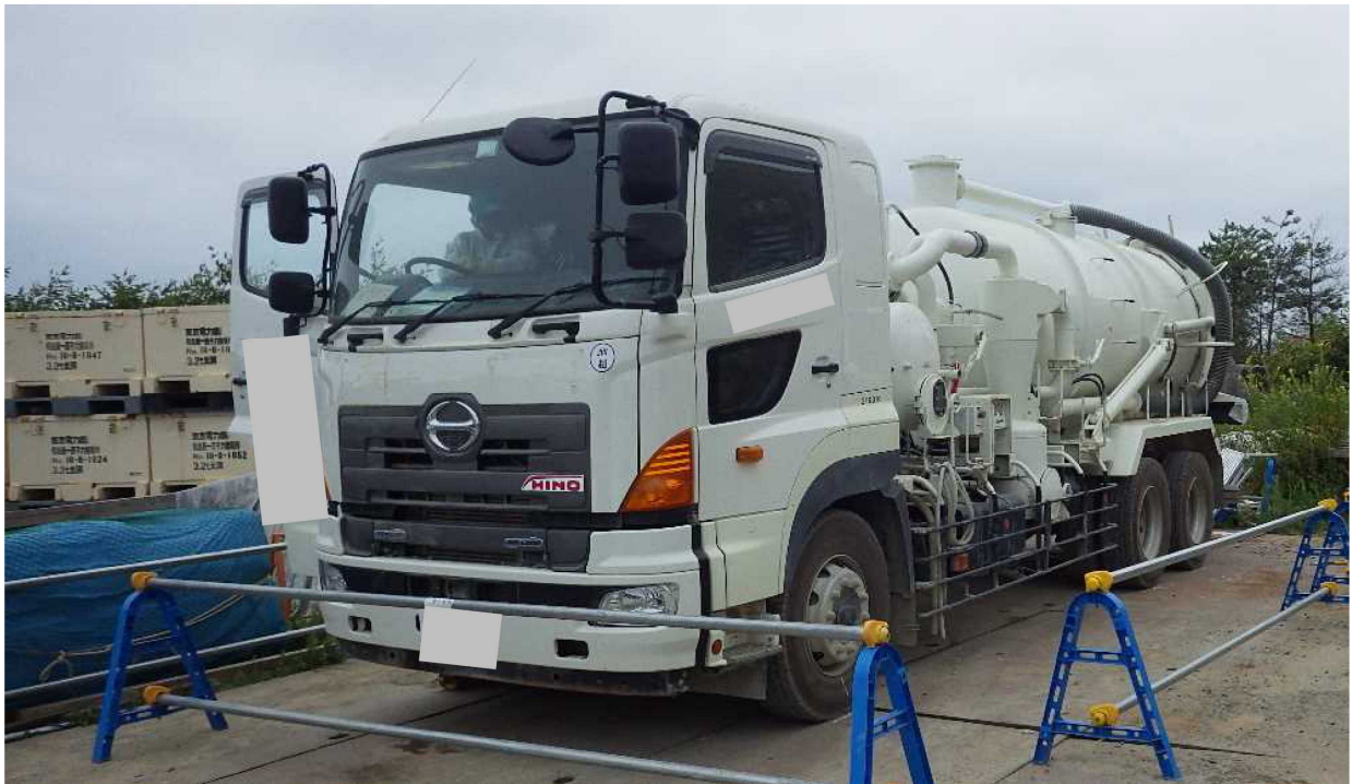
使用車両 (バキューム車／タンク容量10m 3 )