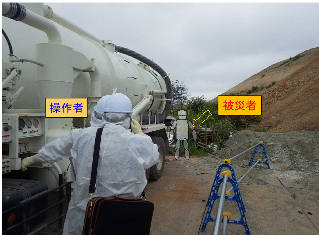
タンク蓋“閉”操作開始時の 操作者と被災者の位置関係 (推定)