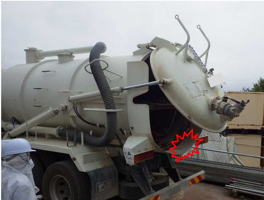
後部タンク蓋開閉動作の確認状況