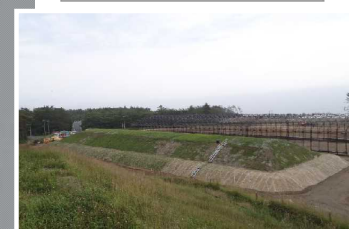
覆土式一時保管施設