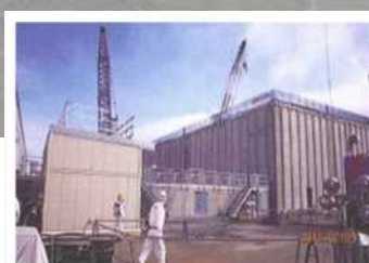
廃スラッジ一時保管施設