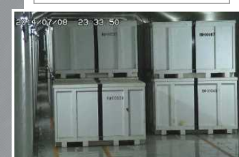
固体廢棄物貯藏庫