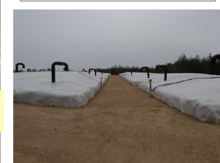
伐採木一時保管槽