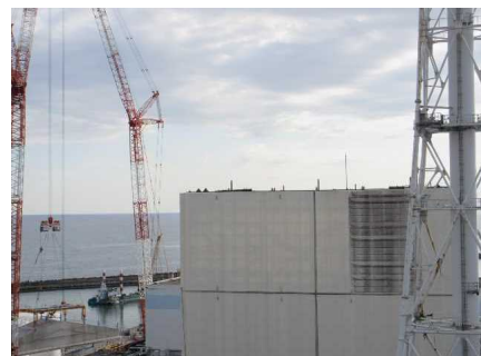
建屋付近から撮影