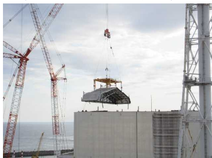
建屋付近から撮影