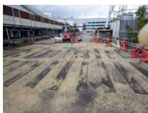
写真① 路盤砕石敷設完了