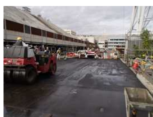
写真② アスファルト舗装中