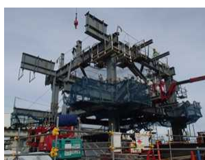
写真③ 5段目ユニット地組