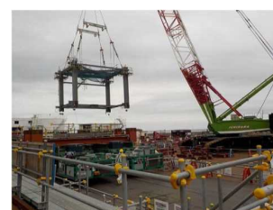
写真④ 地組ユニット運搬