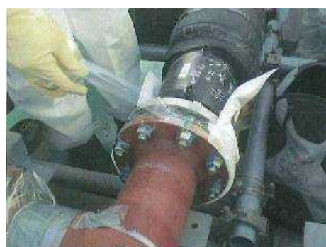
【移送配管フランジ部の吸水材取付】

・移送配管から漏えいした場合に排水路への流入を防止するため、排水路横断部を二重管化。（端部は防水チューブを施工）。