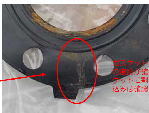
ガスケット (鋼管側面) 拡大

ガスケットの鋼管側の面に漏えいの痕跡が確認された。但し、ガスケットに割れ、変形、異物の噛み込みは確認されなかった。