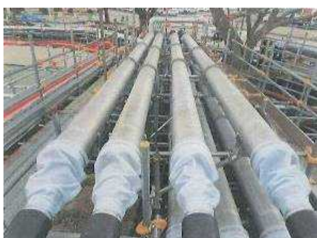
【構内排水路横断部の二重管化】

・移送配管から漏えいした場合に排水路への流入を防止するため、排水路横断部を二重管化。（端部は防水チューブを施工）。