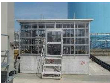
【移送ポンプハウス】