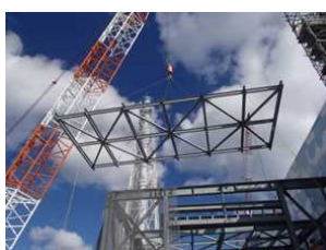
写真④ 前室鉄骨設置状況