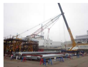
写真⑤ 地上での地組状況