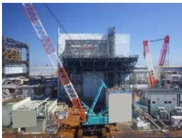
写真③ 2号機原子炉建屋 前室設置状況（全景、2017.3.11撮影）