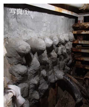
1号機共通配管トレンチ貫通箇所 止水状況