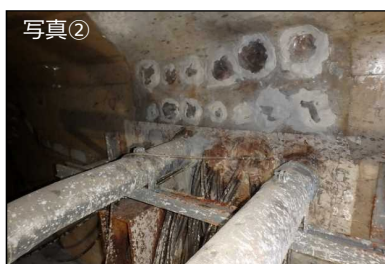
2号機取水電源ケーブルトレンチ貫通箇所 止水状況（写真②）、充填状況（写真③）