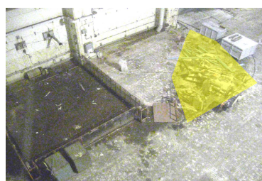
② オペフロ西側の残置物