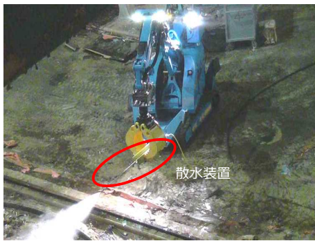
①散水状況（ダスト抑制対策）