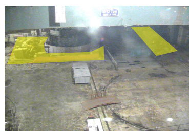
① オペフロ北側の残置物