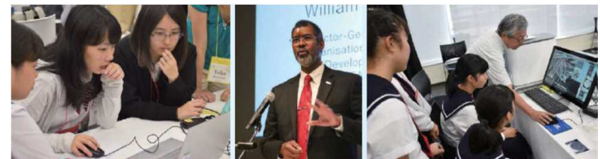
第2回JOSHIKAI（2018年8月開催）の様相