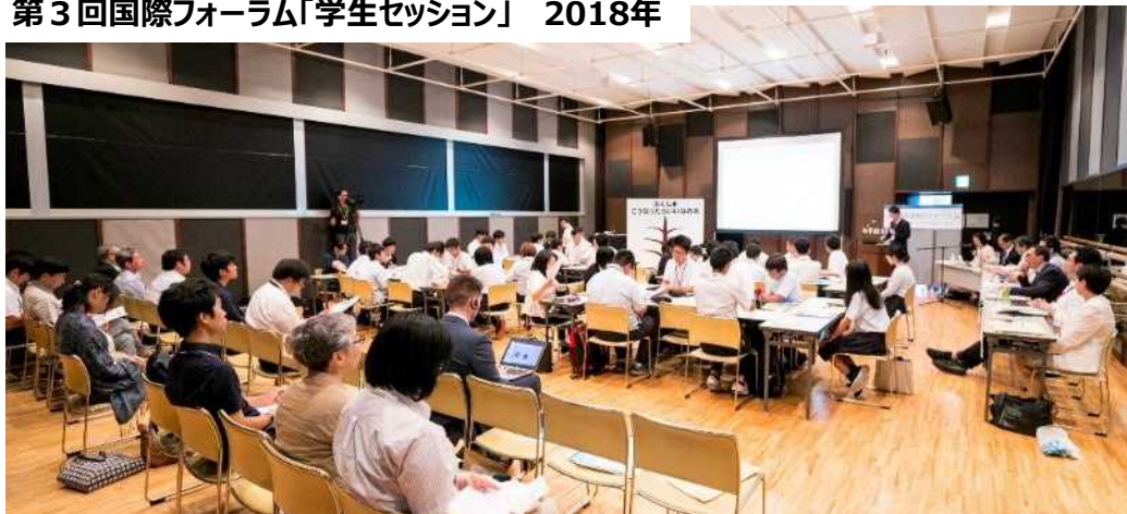
第3回国際フォーラム「学生セッション」 2018年

2019年8月4日（日） 地元の皆様と考える1F廃炉 富岡町文化交流センター「学びの森」 テーマ：「1F廃炉について一番知りたいこと」 対話型ワークショップイベント&学生セッションを同日開催