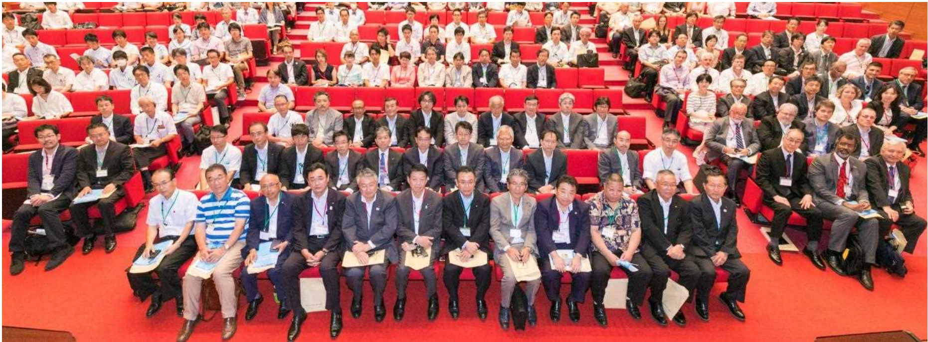
フォーラム登壇者・来賓