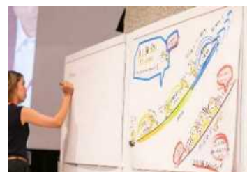
グラフィックレコーディング