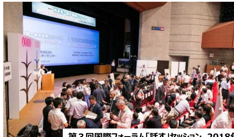
第3回国際フォーラム「話す」セッション 2018年

2019年8月5日（月） 技術専門家と考える1F廃炉 いわき芸術文化交流館アリオス テーマ：「地元共生と廃炉プロジェクト」 国内外からのプレゼンテーション&技術ポスターセッション