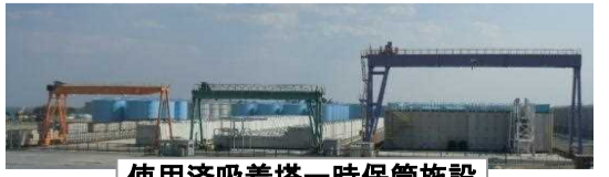
タンクの設置状況