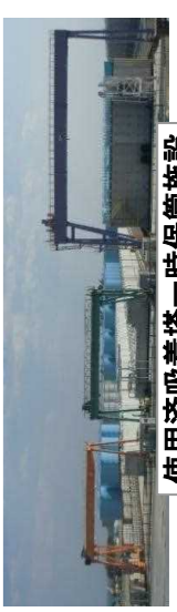
使用済吸着塔一時保管施設