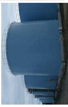
タンクの設置状況