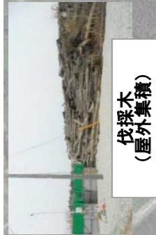
伐採木一時保管槽