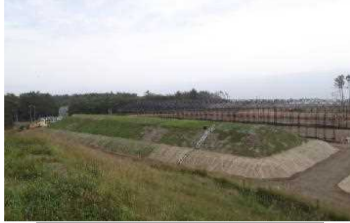
覆土式一時保管施設