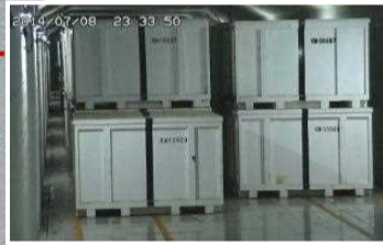
固体廃棄物貯蔵庫