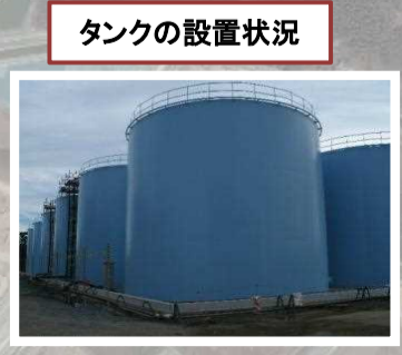
タンクの設置状況