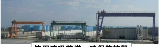
使用済吸着塔一時保管施設