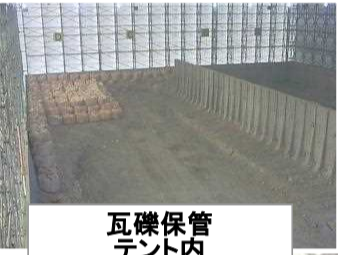
瓦礫保管テント内