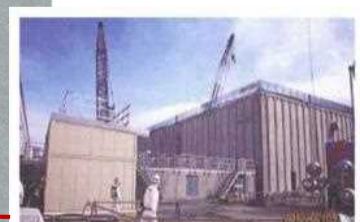
廃スラッジ一時保管施設