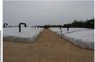
伐採木一時保管槽