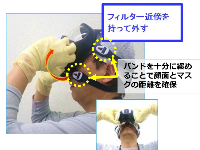
全面マスク脱装例