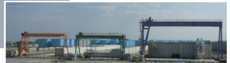
使用済吸着塔一時保管施設