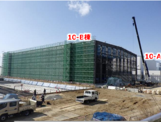
固体廃棄物貯蔵庫第10棟