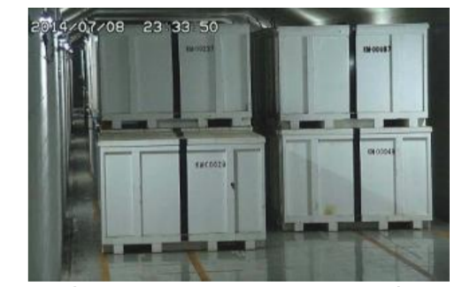
固体廃棄物貯蔵庫