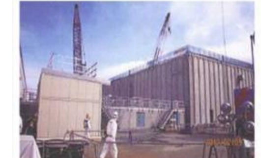
廃スラッジ一時保管施設