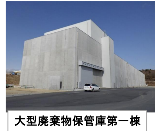
大型廃棄物保管庫第一棟