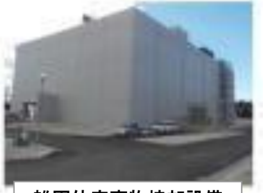
雑固体廃棄物焼却設備