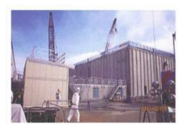
廃スラッジ一時保管施設