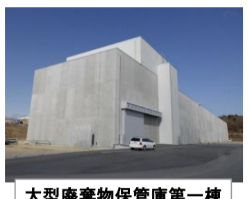
大型廃棄物保管庫第一棟