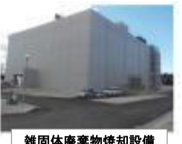
雑固体廃棄物焼却設備