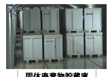
固体廃棄物貯蔵庫