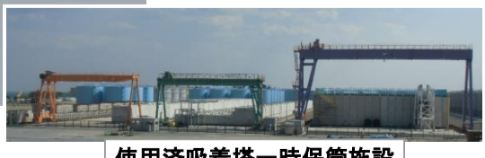
使用済吸着塔一時保管施設