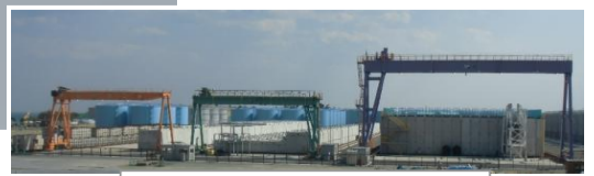
使用済吸着塔一時保管施設