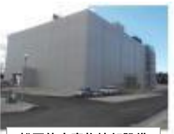
雑固体廃棄物焼却設備