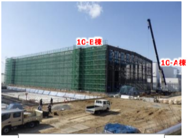
固体廃棄物貯蔵庫第10棟