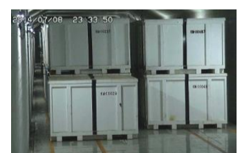
固体廃棄物貯蔵庫