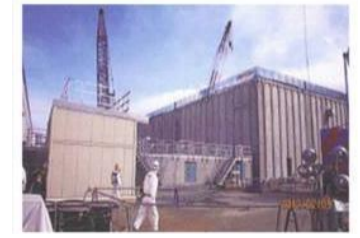
廃スラッジ一時保管施設