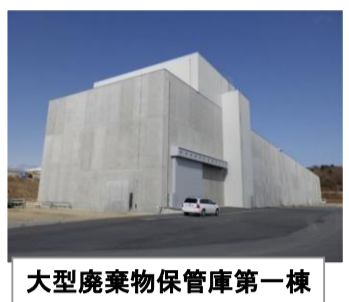
大型廃棄物保管庫第一棟