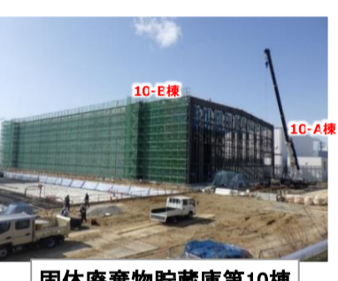
固体廃棄物貯蔵庫第10棟