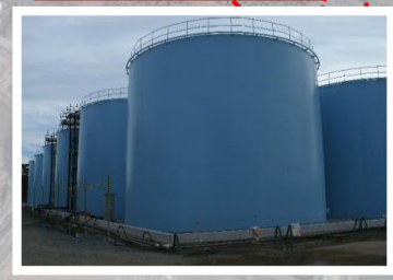
タンクの設置状況