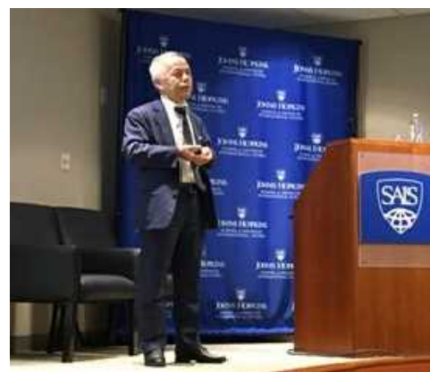
ジョンズ・ホプキンス大（ワシントンDC）